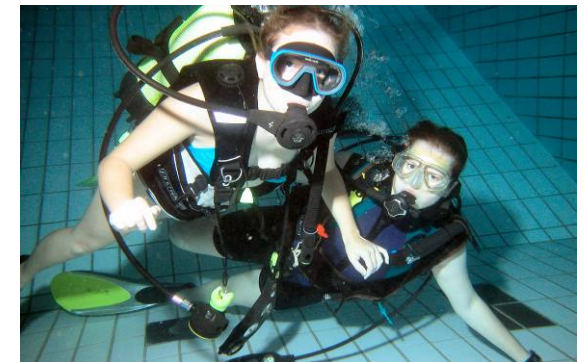
Tot ziens onderwater!

Mocht je nog vragen of opmerkingen hebben, of weet je al zeker dat je lid wilt worden en wil je een inschrijfformulier, e-mail dan naar info@adfundum.info of bel naar een van de telefoonnummers te vinden op www.adfundum.info . Daar kun je nog veel meer informatie, foto's en duikverhalen vinden, die je laten proeven van het geweldige gevoel dat je onder water kunt beleven.